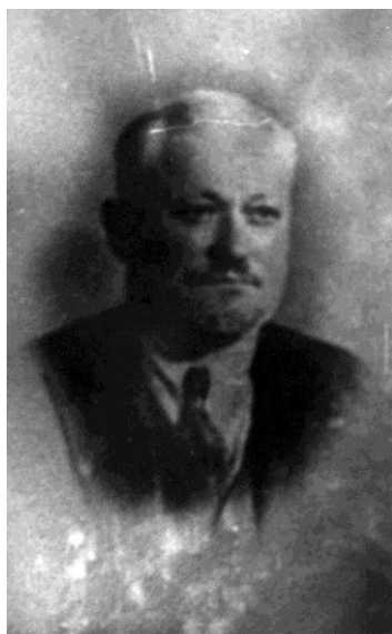
Poză din 1935