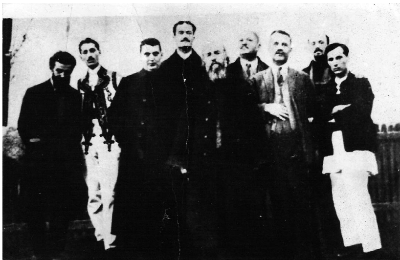
4 ianuarie 1927: membrii fondatori ai „Tovărășiei folcloriștilor olteni“ la Ștefănești – Vâlcea.